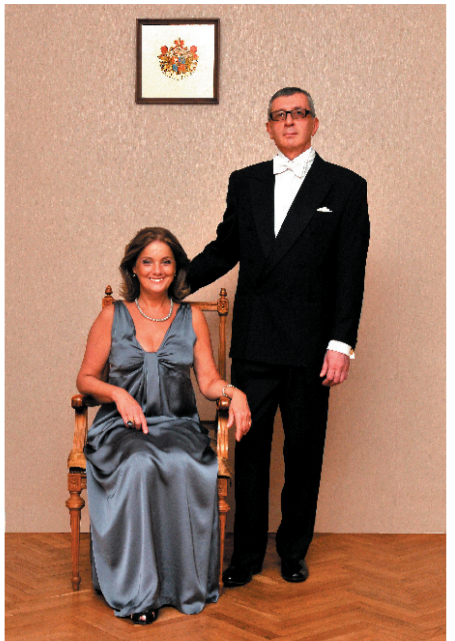
საქართველოს სამეფო ტახტის მემკვიდრე, თანამეცხედრესთან - სამეფო უმადლესობა ლეილა ყიფიანი-ბაგრატიონი-გრუზინსკისთან ერთად